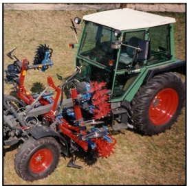
Grada estrella, 4 hileras en tractor portaherramientas Fendt GT 275 para cultivo de fresas.

Herramientas dirigidas por paralelogramo con descompactador, rastrillo para caballones, direccionamiento mecánico, 4 estrellas por hilera.