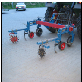
Grada estrella como descompactador de huella.

Portaherramientas con muelle y discos cortantes ondulados, 10 estrellas por hilera.