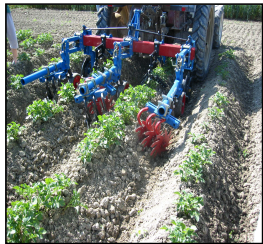
Grada estrella Montaje posterior, 2 hileras para cultivo de patata.

Rodamiento doble, sellado, Cojinete lubricable.