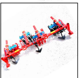
Grada estrella para Fendt GT 231 para cultivo de maíz. Construcción rígida especial del portaherramientas con soportes especiales para rejas descompactadoras, 8 estrellas por hilera.

Objetivo: Escardar, aporcar y desaporcar incluso con alta cobertura de malezas.