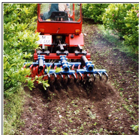
Grada de estrella K.U.L.T.-Kress utilizada en viveros de árboles.